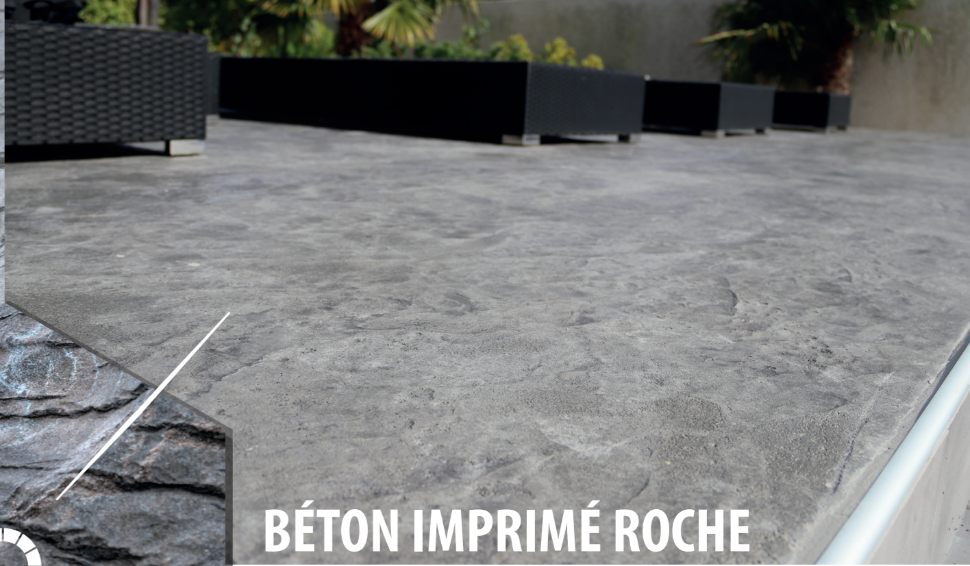
BÉTON IMPRIMÉ ROCHE