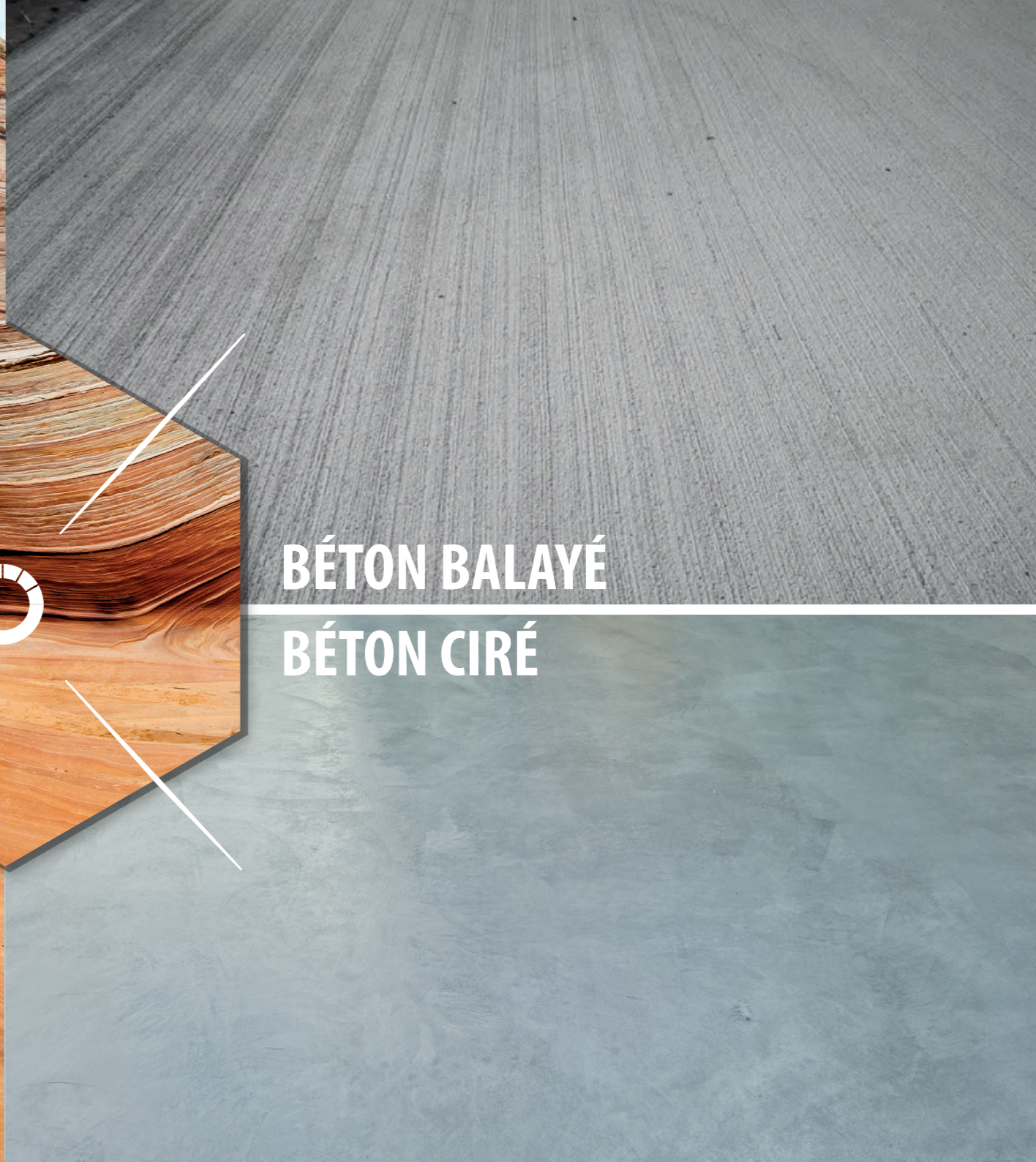
BÉTON BALAYÉ BÉTON CIRÉ