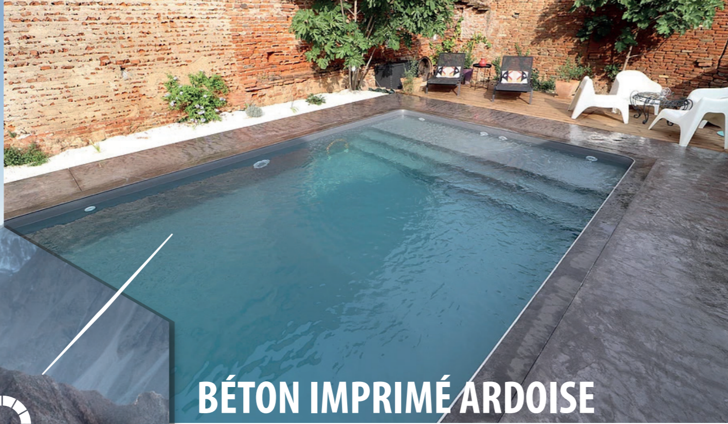
BÉTON IMPRIMÉ ARDOISE